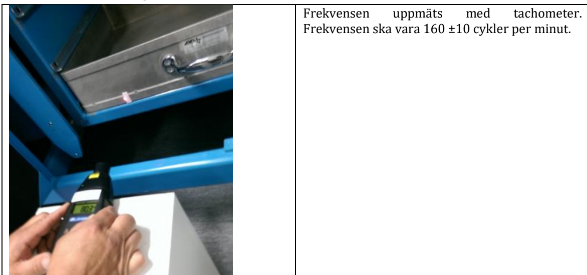
Fig. 3. Exempel på uppmätning av slagfrekvens.